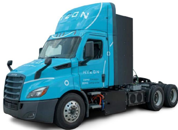
Figura 2. Camión Hyzon Class 8 .

De acuerdo con la especificación técnica presentada en la Tabla I, el camión tiene una autonomía promedio de 704 km. Considerando la cantidad promedio de hidrogeno a bordo siendo 60 kg, el consumo específico por kilómetro recorrido es de 11,70 kg.