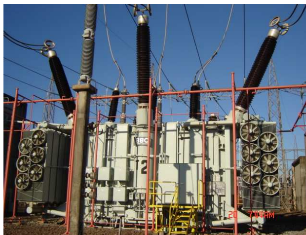
Figura 3: Autotransformador 375 MVA, 550 / 220 kV

El equipo en estudio es un Autotransformador de 375 MVA, 500/220 kV, tipo de refrigeración ONAF, con entrada en operación 02/05/1984. Con carga media de operación de 290 MVA a una temperatura media de 37°C.